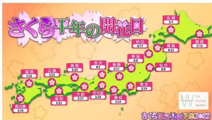
全国主要都市 さくら平年の開花日

今年からツイートは弊社公式ツイッターに ライフビジネスウェザー @LBW_official